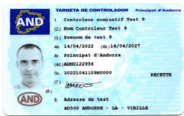
Carte de contrôleur (personne physique)