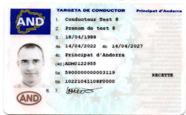
Carte de conducteur