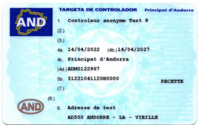
Carte de contrôleur (personne morale)