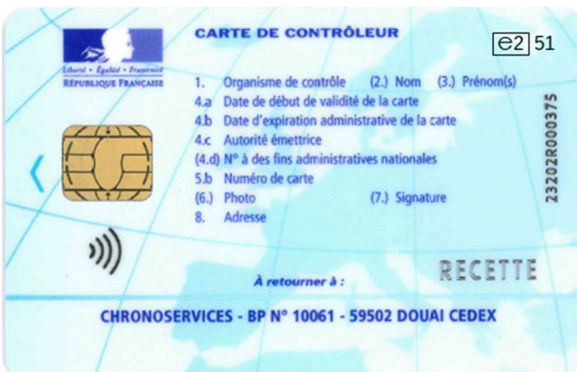
Carte de contrôleur (personne physique)