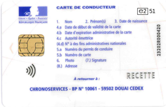
Carte de conducteur