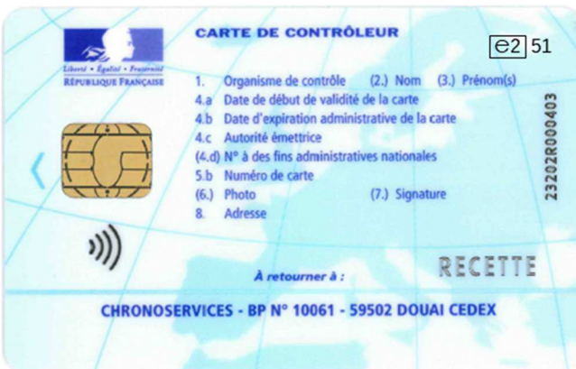
Carte de contrôleur (personne morale)