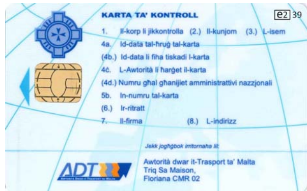
Carte de contrôleur (personne morale)