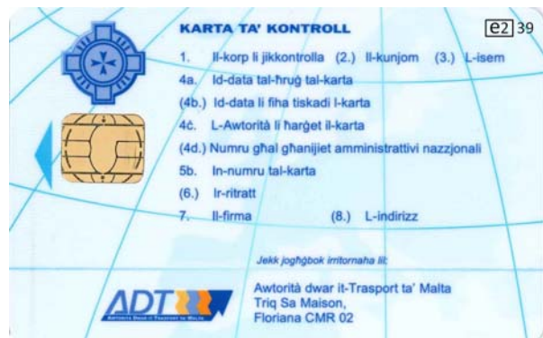
Carte de contrôleur (personne physique)