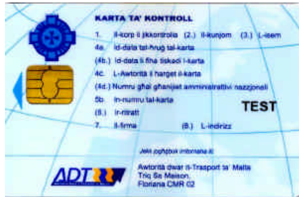
Carte de contrôleur (personne physique)