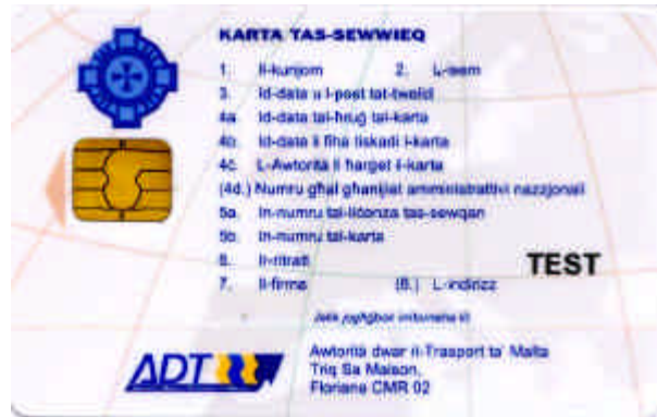
Carte de conducteur