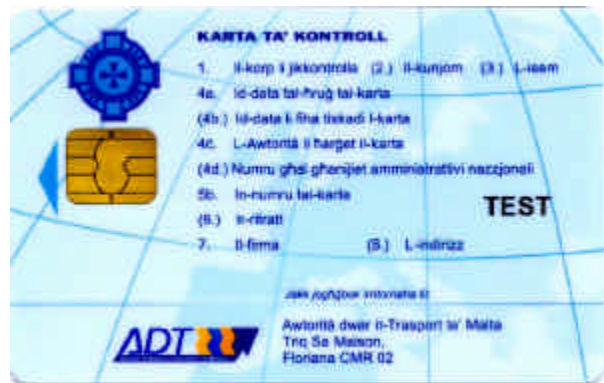
Carte de contrôleur (personne morale)